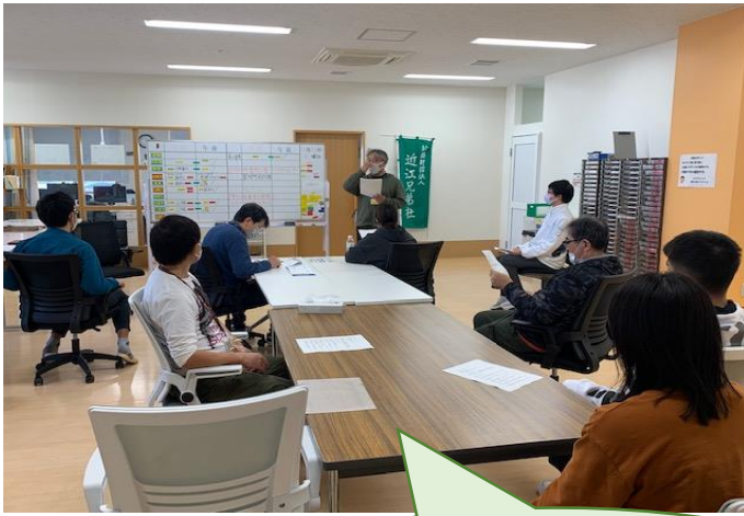
利用者さんによる報告会 「企業見学報告会」

どうぞ皆様、お身体に気を付けて良いお年をお迎えください。引き続き、来年もよろしく願い申し上げます。(12/29~1/3の間は、お休みさせていただきます。)